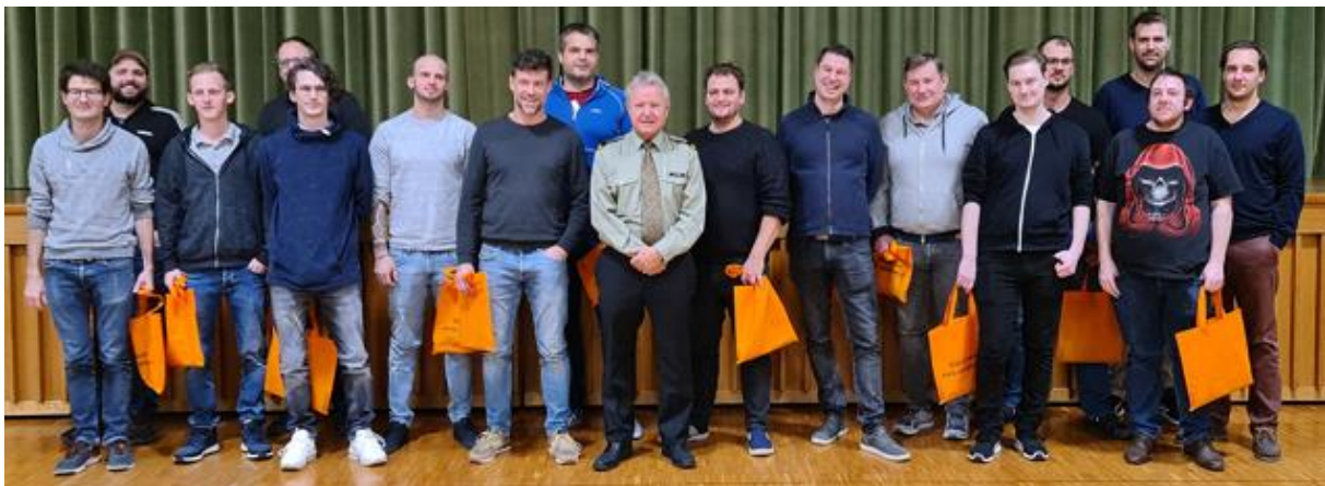
Entlassungen Mannschaft Jahrgänge 1980 – 88